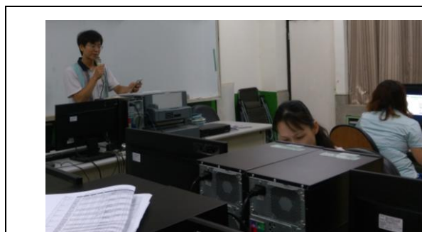
說明：主席宣布複審課程計畫。