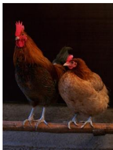
公雞和母雞（維基百科）

（由 Andrei Niemimäki from Turku, Finland - Friends, CC BY-SA 2.0, https://commons.wikimedia.org/w/index.php?curid=3769100 ）